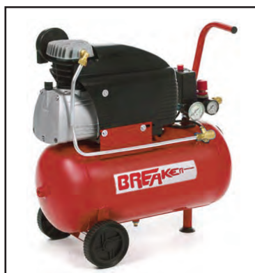
Accionada por un pequeño electrocompresor de tan sólo 3 CV de potencia