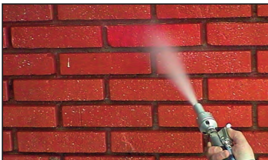
Paredes de ladrillo, de hormigón...