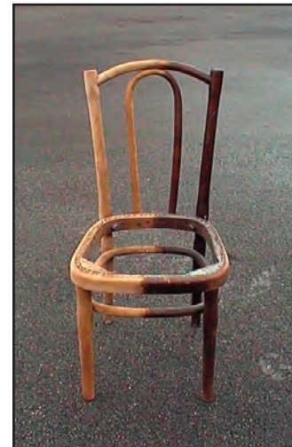
Mobiliarios de madera