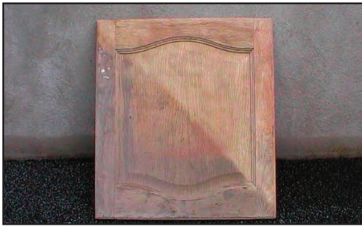
Puertas y ventanas de madera