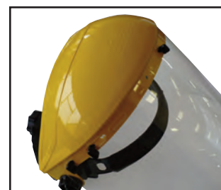
Visera de chorro S-128