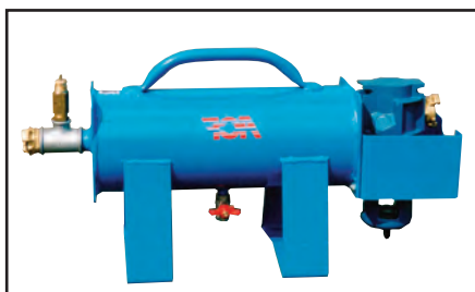
Depurador de aire modelo P-110 (6m 3 / min)