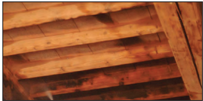
Techos y paredes de madera