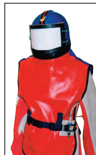
Equipo de protección modelo F-010